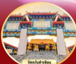
วัดหวังต้าเซียน ขอพรสุขภาพ ความรัก