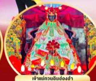
เจ้าแม่กวนอิมฮ่องกง นมัสการองค์เจ้าแม่กวนอิมที่มีอายุกว่า 600 ปี