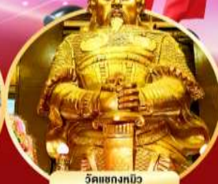
วัดเขกงกมิว ขอพรโชคลาภ การเงิน และธุรกิจ