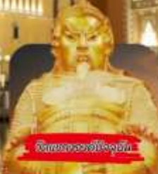
วัดพระทองฮังจูซัน