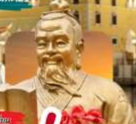
วัดซางฮงเทียน