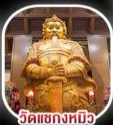
วัดเขangkงหมิว