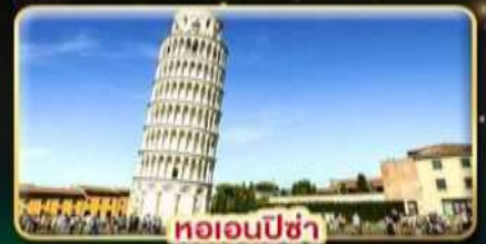
หออนปีซ่า