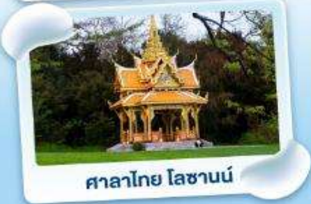
ศาลาไทย ไลซานน์