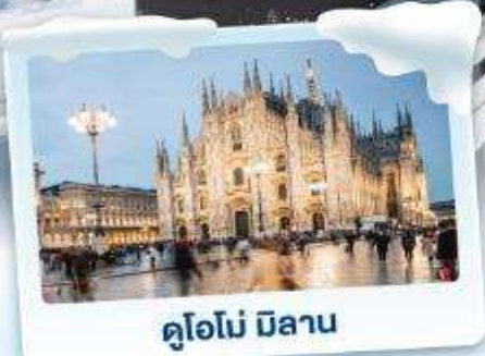
คูโอโม มิลาน