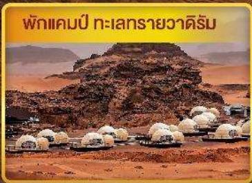
พักแรมปี ทะเลทรายวาดีรัม