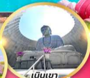
เป็นเขา แห่งพระพุทธรเจ้า