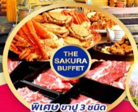
พิเศษ 3 ชนิด (ปูทะเล+ซูโม่+ปูชน)