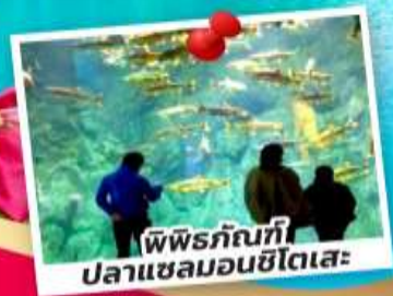
พิพิธภัณฑ์ ปลาเซลมอนชิโตเสะ

ชมซากุระและวิวท่าเรือ โอตารุ ณ สวนเทมียะ