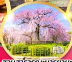
สวนสาธารณะมารุยามะ