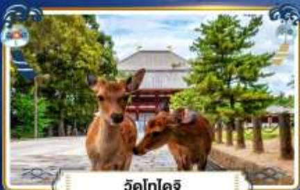
วัดโทไดจิ