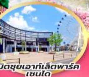
มิตซึยาโอกะเล็ดพาร์ค เซนได

จุดชมซากุระเริ่มต้น ฮิโตะเมะ เซ็มบง ซากุระ