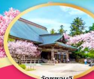
วัดชูซอนจิ