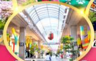
ช้อปปิ้ง ถนนอิชิบังโจ