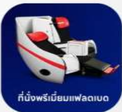
ที่นั่งพรีเมียมแพลตบ

บริการอาหารร้อน และ น้ำดื่ม บนเครื่องบิน ขาไป และ ขากลับ