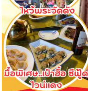
มือพิเศษ...เป่าอ้อ ซิฟูต ไวน์แดง