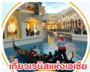
เที่ยวเวนิสแห่งเอเชีย