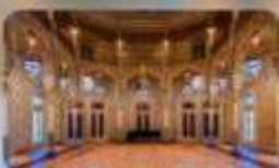
Palacio the Bolsa