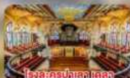
โรงละครปลาลา เดลา บูลีก้า คาตาลาบา