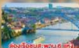
ล่องเรือชมสะพาน 6 แห่ง ในคูร์เมืองปอร์โต