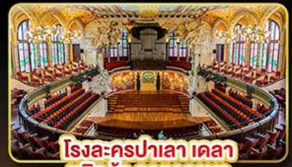
โรงละครปาลาเลา เบลลา มูสิคก้า คาคาลานา