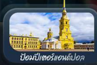
ป้อมปีเตอร์แอนด์ปอล