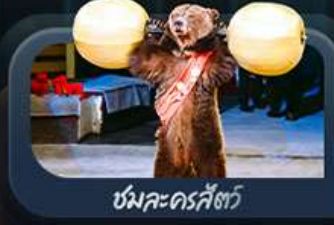
ชมละครสัตว์

highlight สองเมืองไฮไลต์ของรัสเซียที่ไม่ควรพลาด! ตื่นตาตื่นใจกับมหาวิหารเซนต์บาซิล ชมความยิ่งใหญ่ของจัตุรัสแดง สัมผัสอดีตที่พระราชวังเครมลิน ชมความงามของสถานีรถไฟใต้ดินมอสโก ชาร์กอร์ส โบสถ์ไอสิกรีนดี เป็นเขาสเปร์โรวี่ให้คุณได้สัมผัส ชมความงามพระราชวังฤดูหนาว พิพิธภัณฑ์ฮอร์มีทาจ ป้อมปีเตอร์แอนด์ปอล และมหาวิหารเซนต์ไอแซค