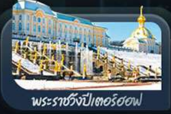
พระราชวังปีเตอร์ฮอฟ