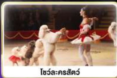
โชว์ละครสัตว์