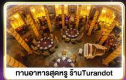
ทานอาหารสุดหรู ร้านTurandot