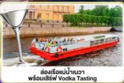
ล่องเรือแม่น้ำเนวา พร้อมเสิร์ฟ Vodka Tasting