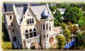
ปราสาทช็อคโกแลตนี้น่า

เมืองซงชี่ หรือเทียบเท่า 3-4* สามารถดูรูปได้ครับ เมืองโกจง หรือเทียบเท่า 3-4* สามารถดูรูปได้ครับ เมืองไทเป หรือเทียบเท่า 3-4* สามารถดูรูปได้ครับ