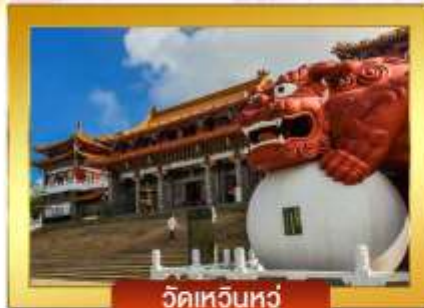
วัดเหวินหลู่