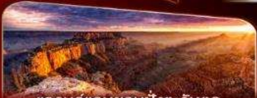
แกรนด์แคนยอนฝั่งตะวันตก