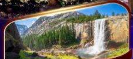
อุทยานแห่งชาติโยเซมิตี

พักลาสเวกัส 2 คืน เต็มอิ่มกับแสงสีแห่งอเมริกา