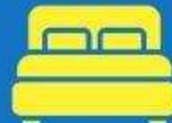
ห้องพักเตียงคู่ DOUBLE