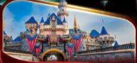
ดิสนีย์แลนด์พาร์ค