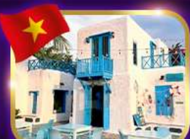
คาเฟ่สุดชิค ซานทรา มารีน่า