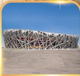
สนามกีฬารังนก