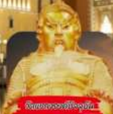
วัดของมาเก๊า