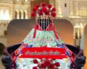
วัดของมาเก๊า