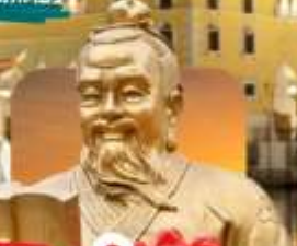
วัดของงก๊ก