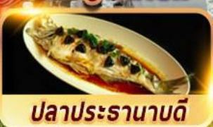
ปลาประธานาธิบดี