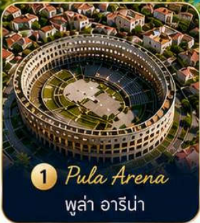
1 Pula Arena พูล่า อารีน่า