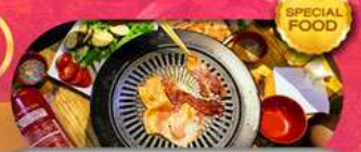
พิเศษเมนู BBQ Buffet เดินทาง มี.ค. - ต.ค. 69