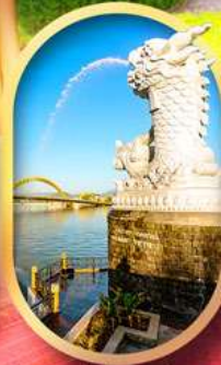
คาร์พดราทอน