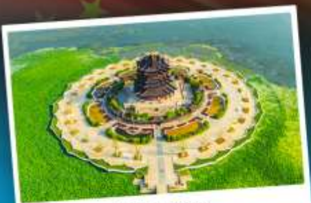
วัดทองหยวน

ล่องเรือชมป่าในน้ำทะเลสาบชิงชาน ไหว้พระใหญ่หลิงซาน เกียวมหนครเซี่ยงไฮ้