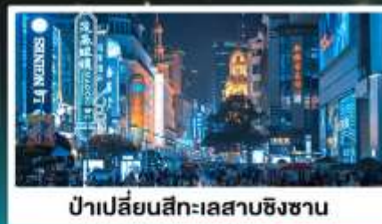
ป่าเปลี่ยนสีทะเลสาบชิงชาน