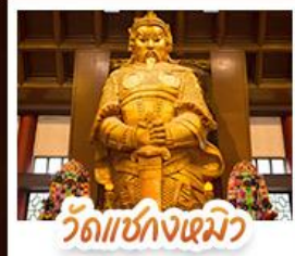
วัดเชกกงไฉมว