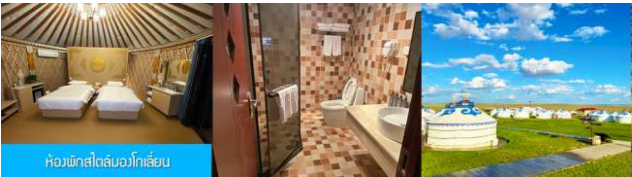
ห้องพักรีสไทม์มองโกลเลียน