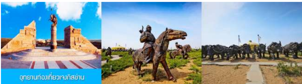
อุทยานก่อกว่กี่ยวเวกิสخاب