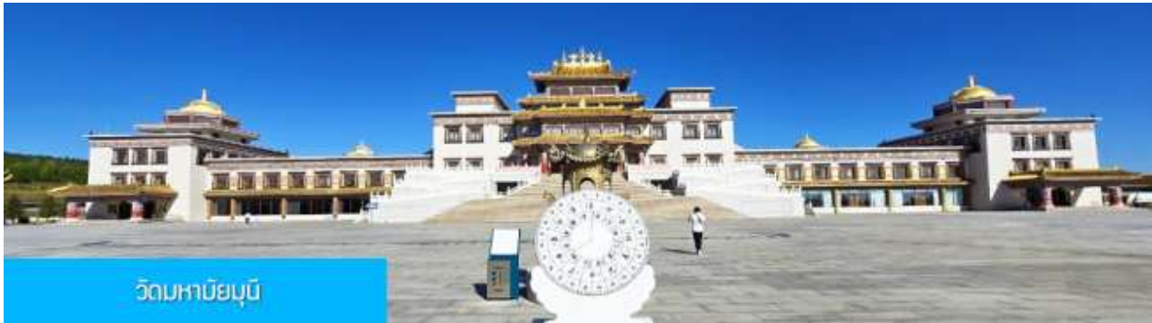
วัดมหาบุญนิ

หลังอาหารเช้าท่านเที่ยวชม สวนวัฒนธรรม หมงกู่หยวนหลิว 蒙古源流 เป็นอุทยานท่องเที่ยวเชิงประวัติศาสตร์และวัฒนธรรมระดับ 4A ของจีน ที่เป็นต้นกำเนิดของชนชาติและวัฒนธรรมมองโกล สะท้อนความเป็นจักรวรรดิที่ยิ่งใหญ่เมื่อ 700 ปีก่อน ชม ประตูงเทียน 崇天门 สุดมโหฬารที่แสดงถึงความยิ่งใหญ่ของจักรวรรดิมองโกล ชม พระราชวังหมิงจำลอง 大明殿 ที่สร้างขึ้นเพื่อใช้เป็นสถานที่ประกอบพิธีสำคัญของราชวงศ์หยวน ชม จัตุรัสถึงเก้อหลี่ 腾格里广场 จัตุรัสกลางแจ้งขนาดใหญ่ที่ใช้ประกอบพิธีกรรมต่าง ๆ