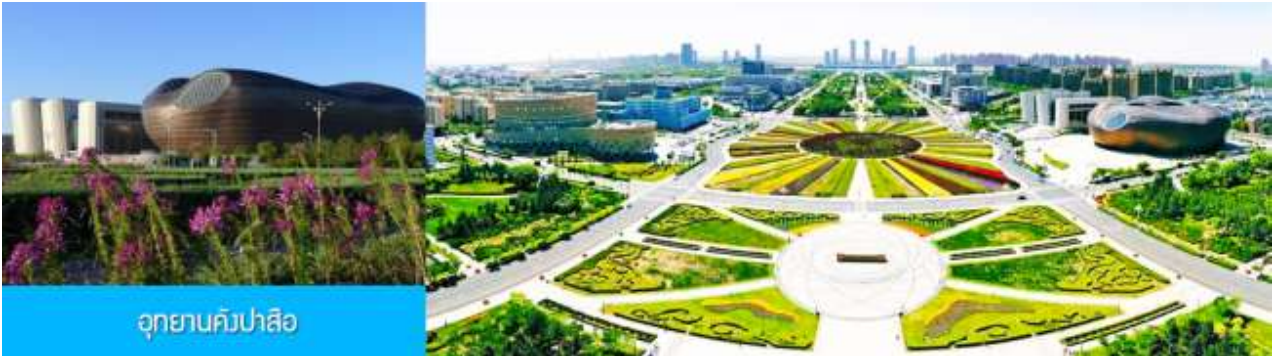
อุทยานคังปาสื่อ