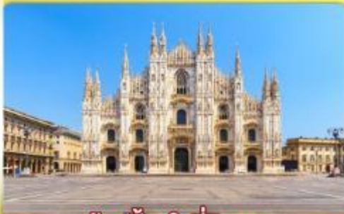
ซอปป์ิงจู่ที่มิลาน