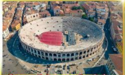
โรงละครโรมันกลางจัหวโรม่า