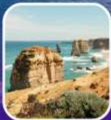
Great Ocean Road (ครึ่งสาย)