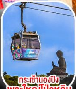
กระเช้าแองปัง พระใหญ่ไผ่หลิน