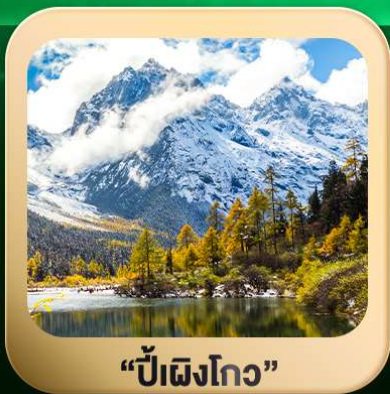
“ปี้ผิงโกว”

ชมธรรมชาติ 2 อุทยานขึ้นชื่อ อุทยานภูเขาสีดรุณี + อุทยานปี้ผิงโกว สะพานหนานเฉียว • ถนนคนเดินไท่กู่หลี่ + ซุนซีลู่ + Pop Mart • ตงเจียวจื่อ