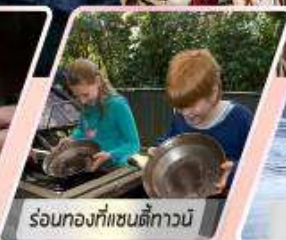
ร้อนท้องที่แซ่ดตีทาวน