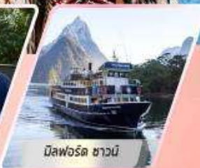
มิสฟอร์ด ชาวน์