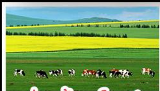
ทุ่งหญ้าเออร์ดอส

ทุ่งหญ้าเออร์ดอส สุสานเจกิสข่าน แกรนด์แคนยอนแม่น้ำเหลือง