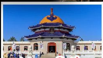
สุสานเจกิสข่าน