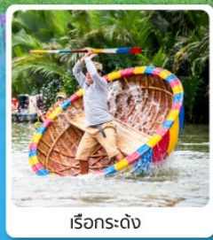
เรือกระดั้ง