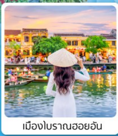
เมืองโบรมำนฮอยอัน