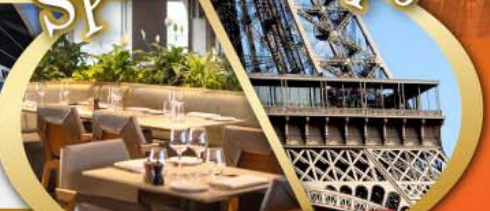
รับประทานอาหารกลางวันบนหอคอยเฟร่า