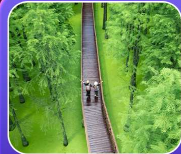
“ป่าสนชิงซาน”

T2G-HGH01GJ Welcome Hangzhou...หังโจว ฉู่โจว ฉู่หยวน ช่างเหรา หุบเขาเทวดา 5D 4N (GJ)