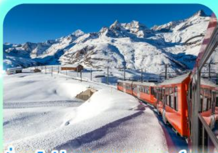
นั่งรถไฟสู่ยอดเขารอนเนอส์เกรต