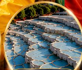
ปามุกคาล่า Pamukkale