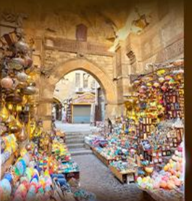
ตลาดงานอเล็กซันเดรีย