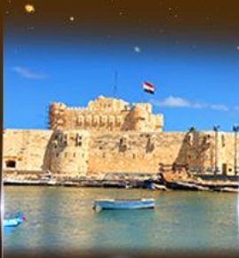
บ่อนประมาร Quite Bay