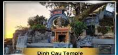
Dinh Cau Temple