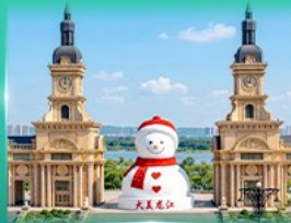
ตุ๊กตาหิมะยักษ์ ฮาร์บิน