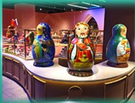
พิพิธภัณฑ์ ตุ๊กตาเป่ลู่กอก