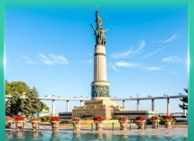
อนุสาวรีย์มังกร