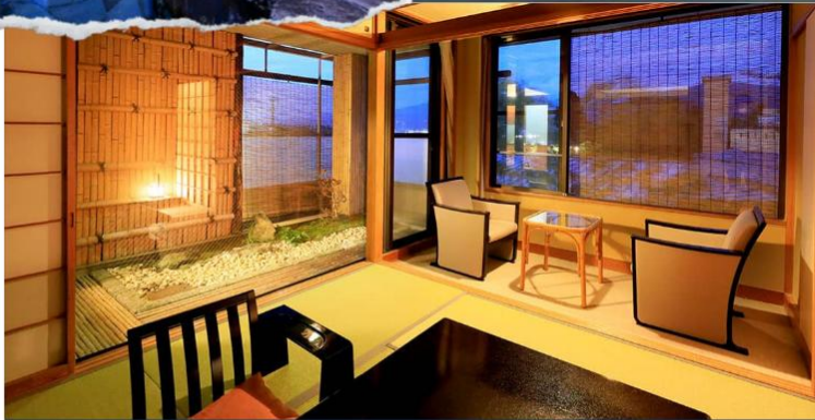
Japanese-style Room 17 sqm