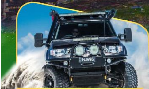
คันรถ 4WD สู่ใจกลางเทือกเขาคอเคซัส