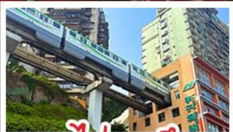
รถไฟทะลุคด