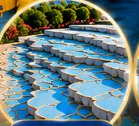
ปามุกคาล์ Pamukkale