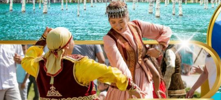
Huns Ethno Village