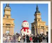
ตึกตาคิยะยักซ์