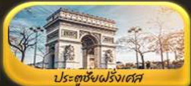
ประตูชัยฝรั่งเศส

พิเศษ!! ล่องเรือแม่น้ำแซนชมเมือง โดย บาโด มูช